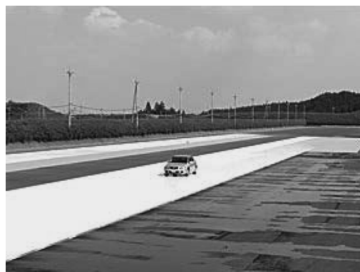
図1 低 \mu 路

JARI三石様からは、水素エネルギー社会に向けたシナリオ、JARI Hy-SEFの活動紹介があり、また見学した設備で行われた実車両による着火試験や、水素容器の火炎暴露試験な